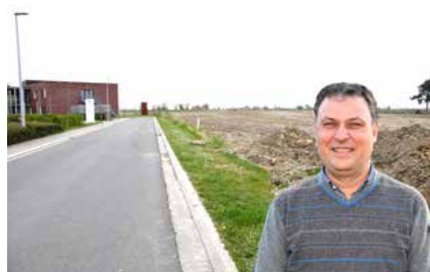
▲ Het vrijgekomen geld moet de kwaliteit van de ouderenzorg in Langemark-Poelkapelle nog verhogen.