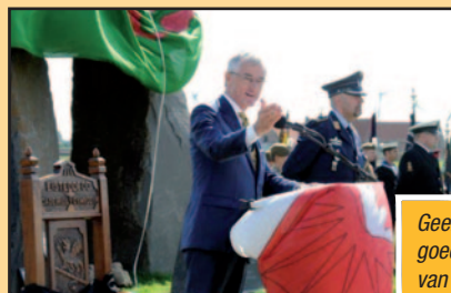
Geert Bourgeois benadrukte de goede en kwalitatieve herdenking van de 'Grote Oorlog'.

Na de plechtigheid nam de minister-president ruim de tijd om te praten met de lokale mandatarissen en de aanwezigen. Hij duidde nogmaals op het belang van een goede en kwalitatieve herdenking van 100 jaar Eerste Wereldoorlog. Een herdenking die onder zijn impuls werd opgezet.